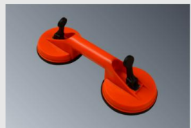
Saugnapf zur Glasöffnung der Hound/4 MAG

Irrtümer und technische Änderungen vorbehalten!