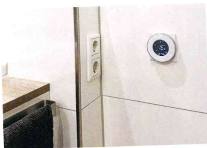
Der neue Digital Design Temperaturregler kann sowohl mit den Dünnbettheizmatten als auch bei der Estrichspeicherheizung eingesetzt werden.

Passend zu seinen Produkterweiterungen im Bereich elektrischer Flächenheizungen hat die herotec GmbH Flächenheizung aus Ahlen den WiFi-fähigen „Digital Design Temperaturregler“ auf den Markt gebracht. Dabei handelt es sich um einen elektronischen Regler mit Zeitsteuerung zur Temperaturregelung in Einzelräumen.