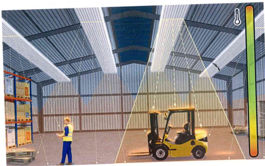
Effiziente Strahlungswärme mit KSP to go: Ausführliche Informationen gibt es im neuen Katalog.

Effiziente Technologie auf den Punkt gebracht – das steckt hinter dem Baukastensystem KSP to go. Damit lassen sich kleinere Hallen schnell und einfach mit Deckenstrahlplatten ausstatten. Die De-