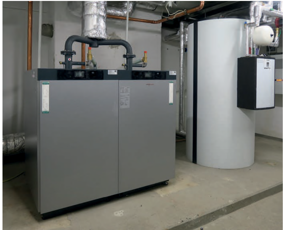
! Eine Zweier-Kaskade und ein Pufferspeicher mit Frischwasserstation bilden das Herzstück der Heizungsanlage.

Insgesamt rund 84 m 2 Deckenstrahlplatten beheizen Teilbereiche der Trampolinhalle Up-Sprung. Die Elemente fallen durch ihre weiße Farbe kaum auf, zumal farbige Lichtwürfel