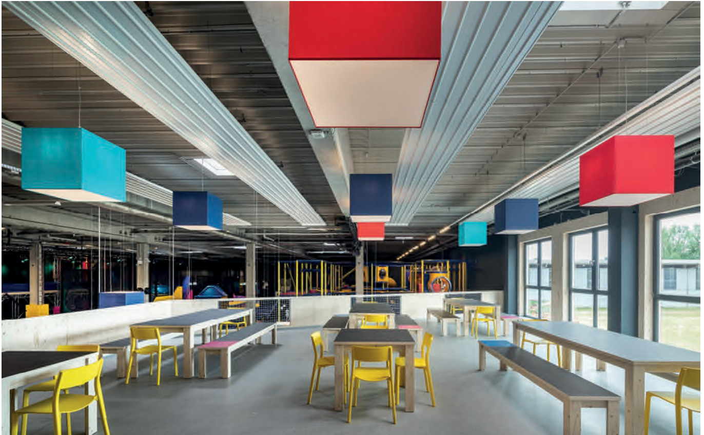
! Vier Deckenstrahlbänder aus KSP classic liefern die Wärme für diesen Hallenbereich.