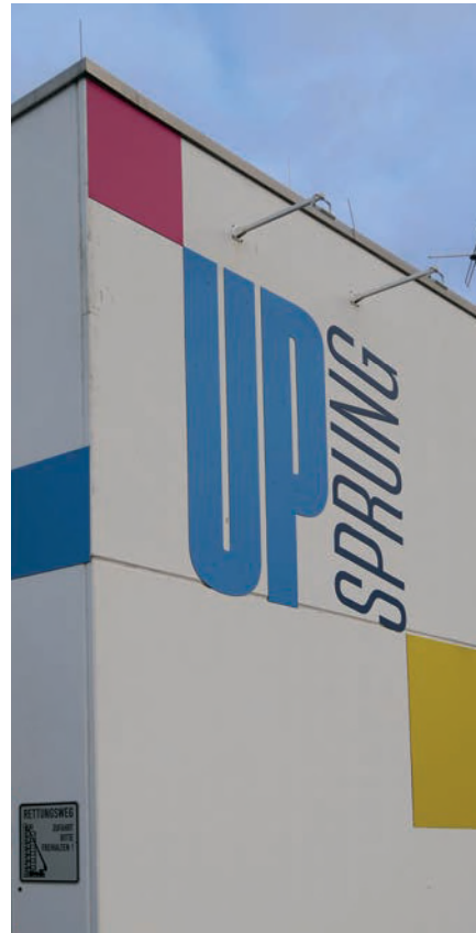
Fröhliche Farben an der Fassade der Trampolinhalle UpSprung.

erwärmt, sondern die Umgebungsflächen. Dadurch kann die Temperatur um bis zu 4 K gesenkt werden, was eine große Energieeinsparung zur Folge hat. Auch die schnelle Reaktionszeit des Systems hilft, die voreingestellte Temperatur von 20 °C in der Halle permanent zu halten.