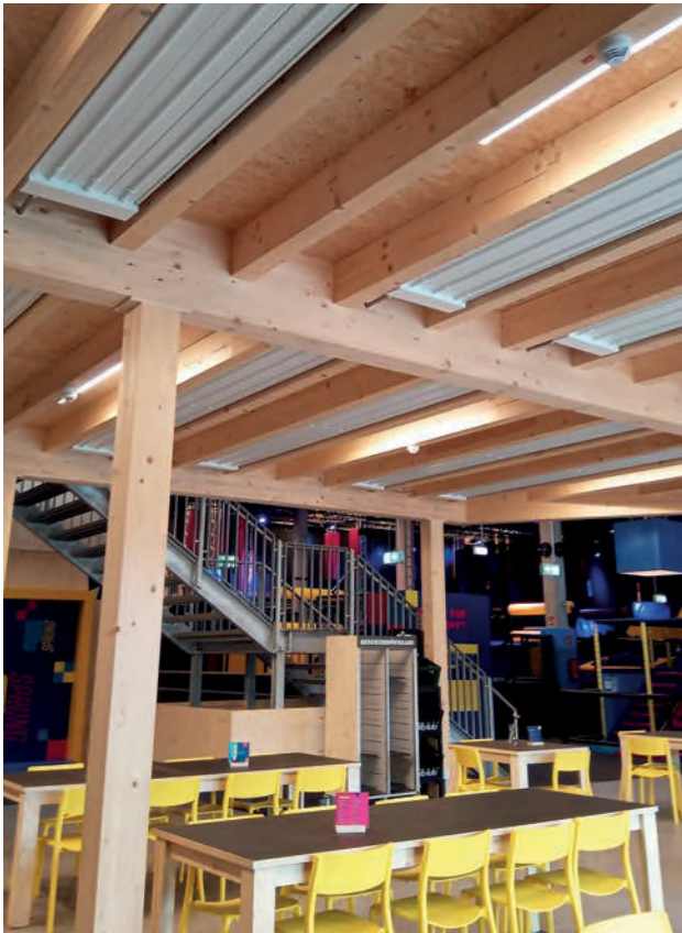
Wie gut sich die Deckenstrahlplatten zwischen die tragenden Balken einfügen, ist hier zu erkennen.