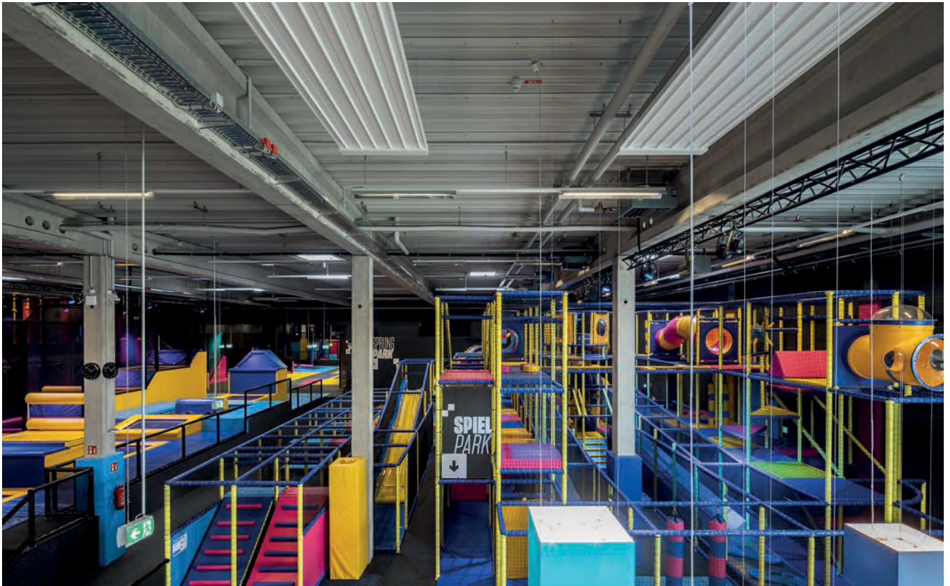
Freizeit, Sport und Spaß bietet die Trampolinhalle UpSprung in Osnabrück.

Heizzentrale. Der Speicher verfügt über eine nachgeschaltete Frischwasserstation und eine Unterverteilung. Der Reserveabgang des vorhandenen Verteilers wird für die Unterverteilung genutzt.